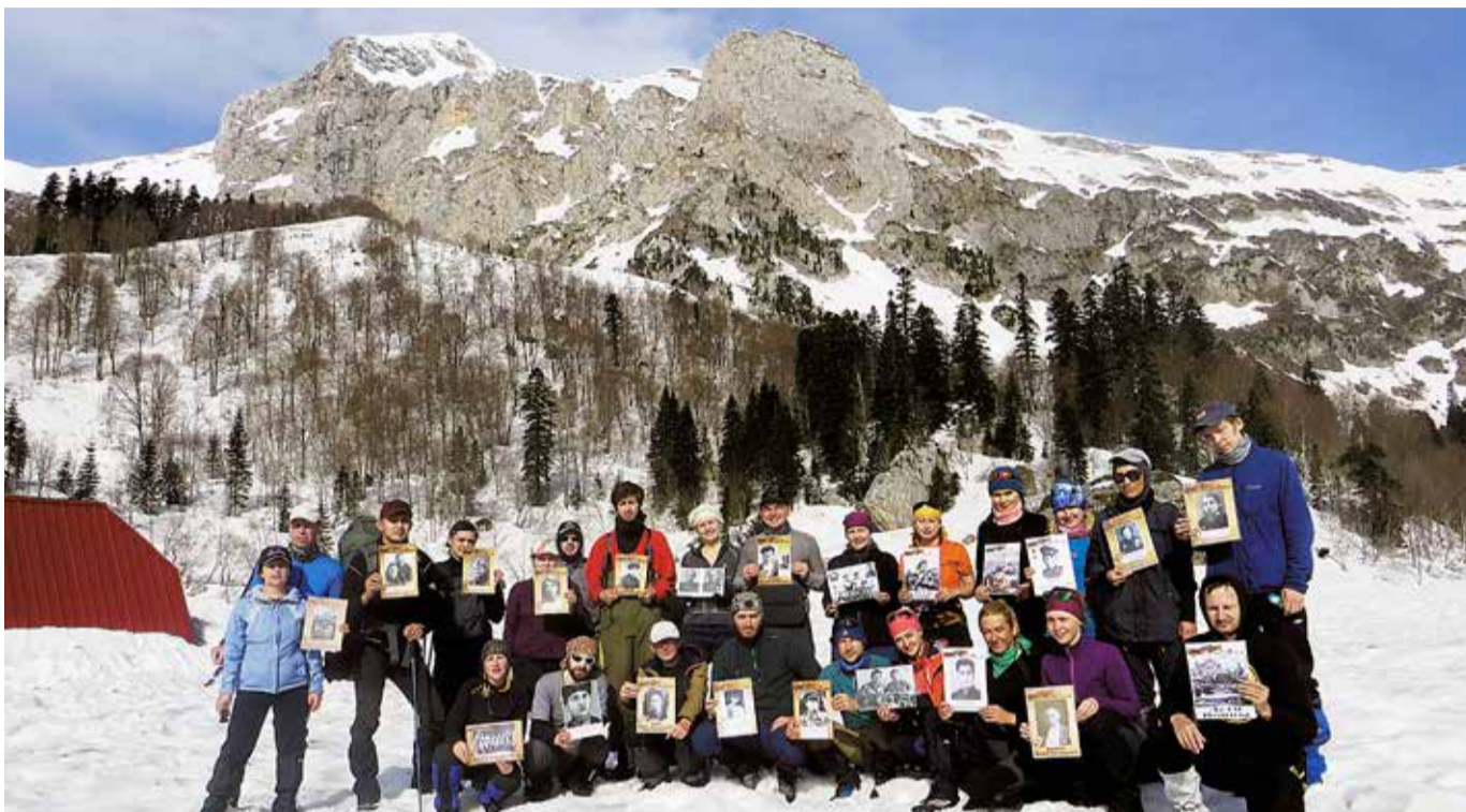
Участие в патриотической акции, которая была проведена в форме туристского пешеходного перехода в горной части плато Лаго-Наки, по боевому пути 23-го пограничного Краснознамённого полка войск НКВД СССР, приняли участие родители совместно с детьми.

«ПАТРИОТИЗМ – ЭТО НЕ ЗНАЧИТ ТОЛЬКО ОДНА ЛЮБОВЬ К СВОЕЙ РОДИНЕ. ЭТО ГОРАЗДО БОЛЬШЕ. ЭТО – ОСОЗНАНИЕ СВОЕЙ НЕОТЪЕМЛЕМОСТИ ОТ РОДИНЫ И НЕОТЪЕМЛЕМОЕ ПЕРЕЖИВАНИЕ ВМЕСТЕ С НЕЙ ЕЕ СЧАСТЛИВЫХ И ЕЕ НЕСЧАСТНЫХ ДНЕЙ».