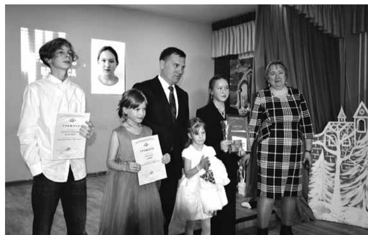
Церемония награждения лауреатов «Воспитанник года-2023».

Ну, и конечно, самое главное – церемония на-