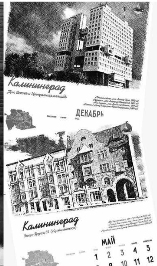
Кинокалендарь Калининградской области на 2024 год от проекта «Снято в Калининграде».

ный маршрут по ушедшему в прошлое Калининграду и другим городам области. Ведь кинофильмы, как своеобразная машина времени, могут перенести нас на десятилетия назад.