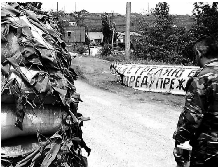
В Чечне блокпосты стали неотъемлемой частью жизни людей во время войны, а также после ее окончания.

Лязгнула дверца Урала. Шаги в нашу сторону. Густоту ночи разорвал. Порвал на куски мороз звезд звонкий, практически детский голос. Слова, учитывающая ситуацию, абсурдные и неуместные: «Стой! Стрелять буду!».