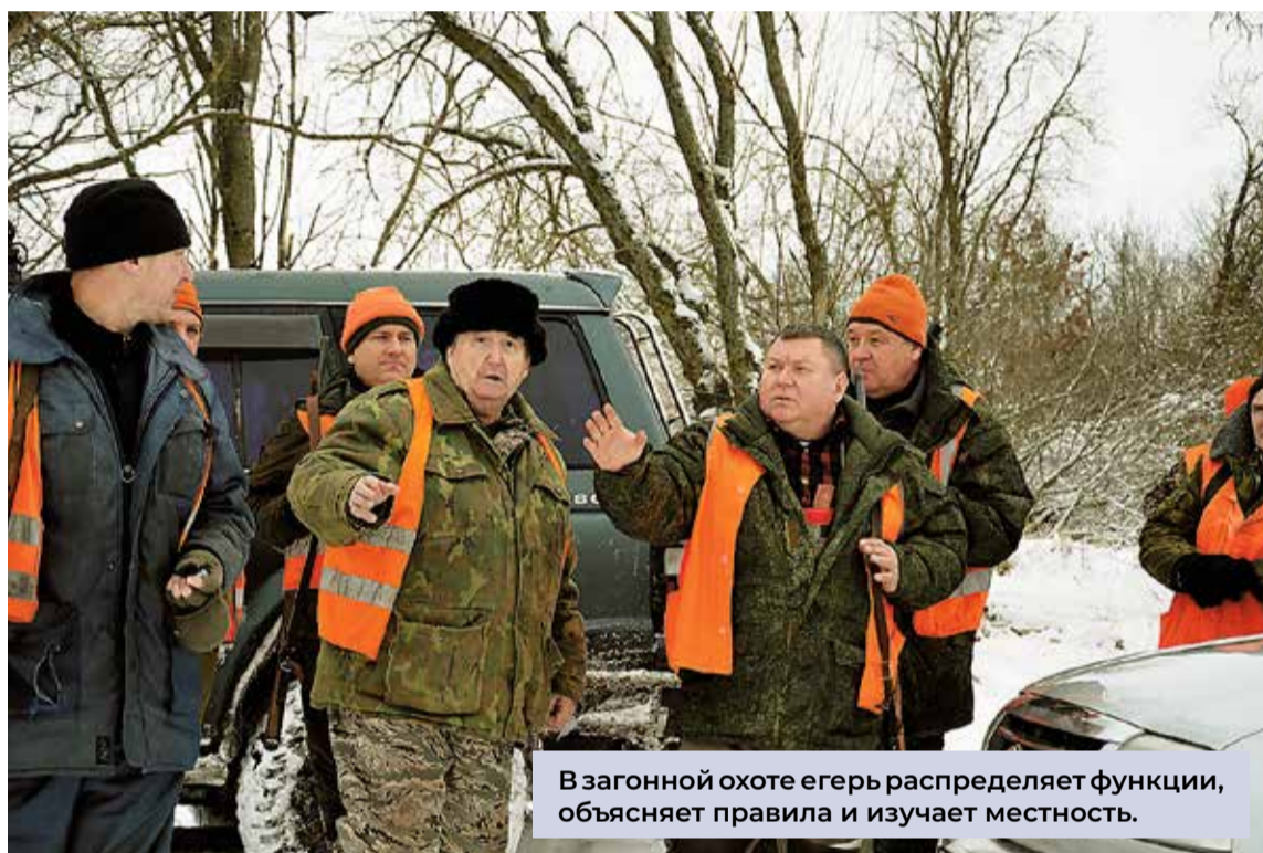
В загонной охоте егеря распределяют функции, объясняют правила и изучают местность.