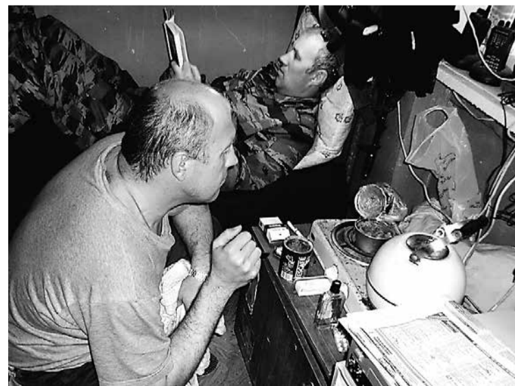
Быт на войне: печка из бочки, термосы из «Градов», консервы из кильки...