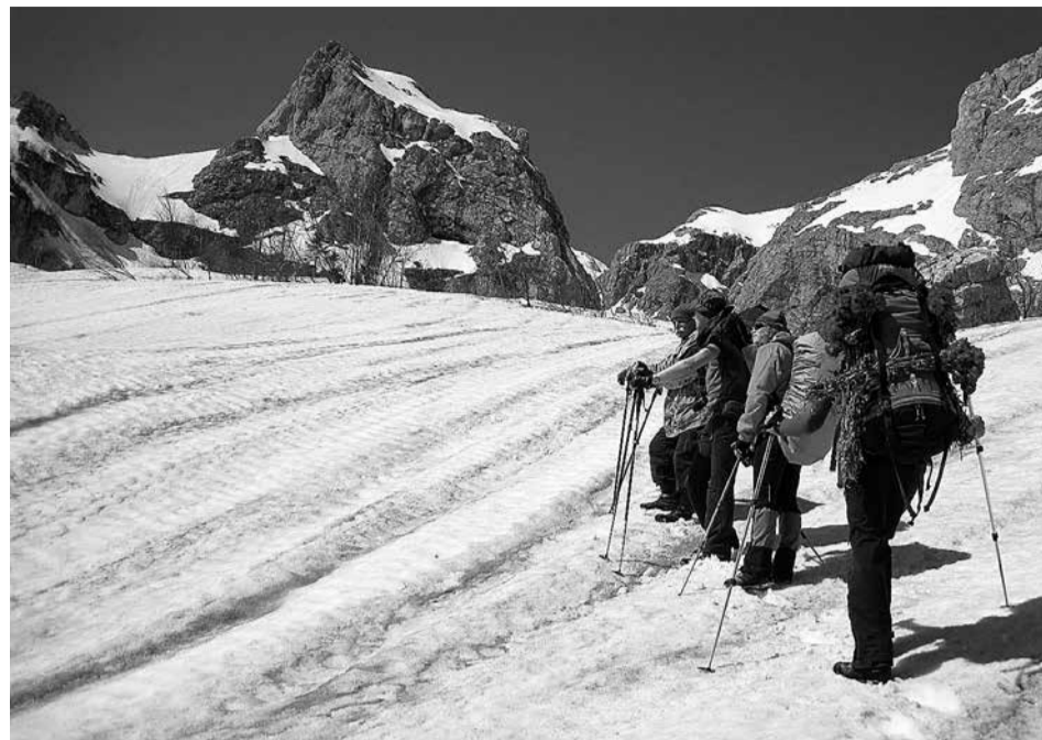
По боевому пути 23-го погранполка: Фишт-Оштеновский массив Западного Кавказа.

В подмогу опыт, знание, чутьё. Зелёные фуражки надевая, Как перед боем чистое Бельё.