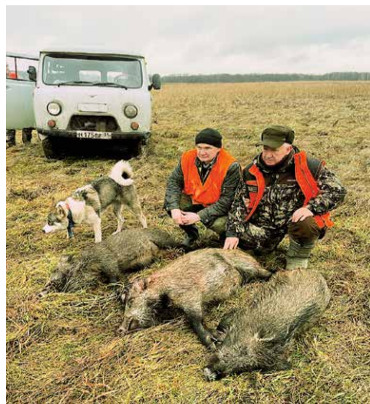
Кабан – лучший охотничий трофей.

помогает ему улавливать находящуюся в окрестностях опасность, такую как хищники или люди. Однако, если охотник соблюдает все известные предписанные для зимней охоты правила и законы – успех в его походе на косулю практически обеспечен.