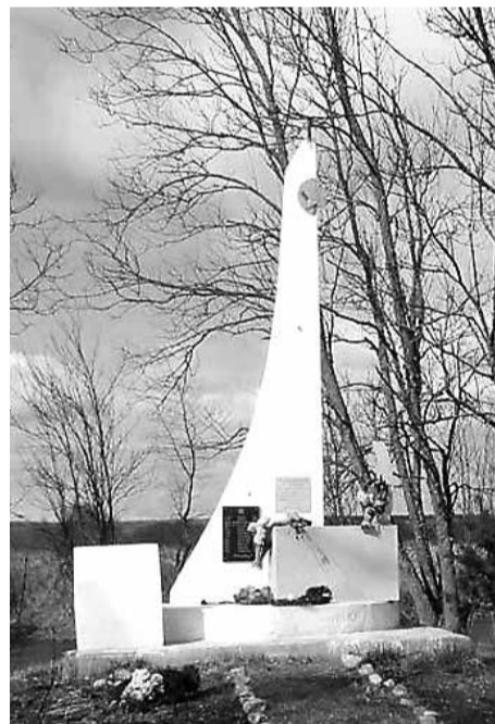
Памятный знак разведгруппе «Мороз» возле п. Гастеллово Славского муниципального округа установлен в 1991 году.