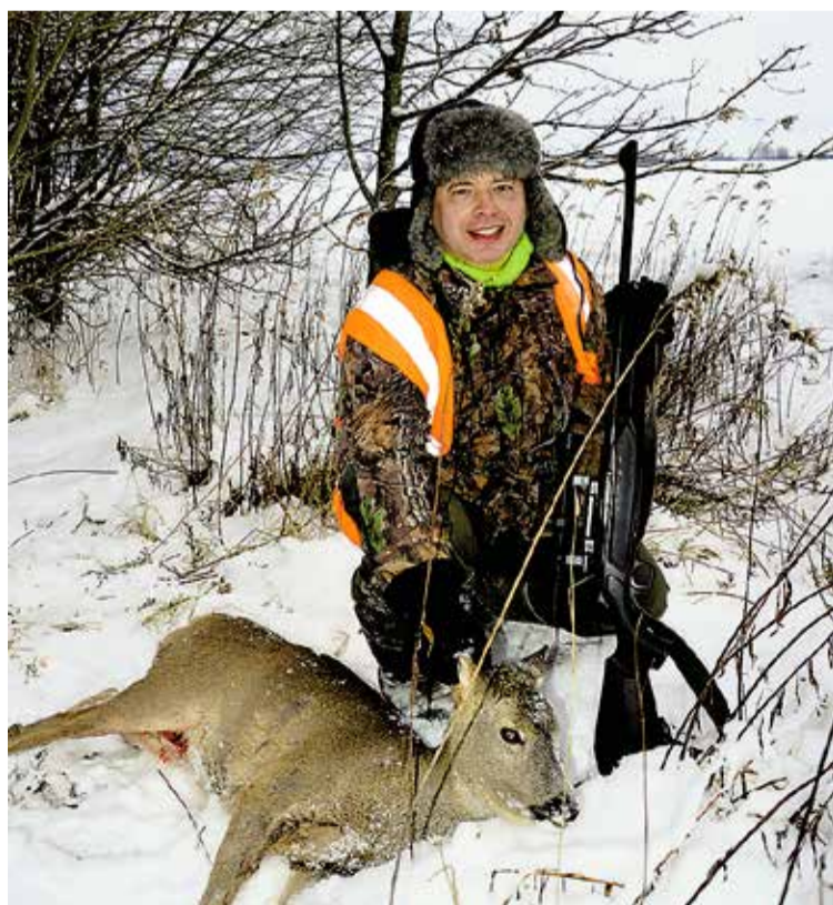
Добыча косули на зимней охоте – хорошее подспорье для семейного бюджета.

Особый интерес вызывает охота на косулю, которая ценится за своё нежное мясо. Этот небольшой копытный зверек имеет превосходное обоняние, зрение и слух, что