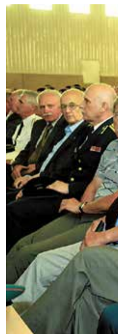
Начальником Погрануправления и ветеранами отдают дань памяти в почётном карауле членам старой гвардии. Ветеранское собрание ветеранского отряда Погрануправления.