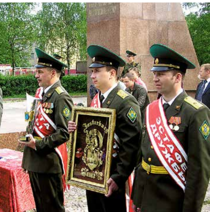
посвящённая 63-й годовщине Великой Победы советского Отечества и 90-летию пограничных войск стра- 08 год.