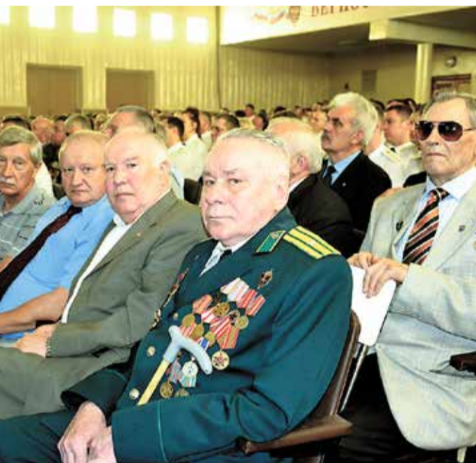
аничного управления ФСБ России по Калининградской об- ласти «100 лет учреждения пограничной службы» вручены одии, внёсшим весомый вклад в развитие и совершенство- р движения. Калининград, май 2018 года.