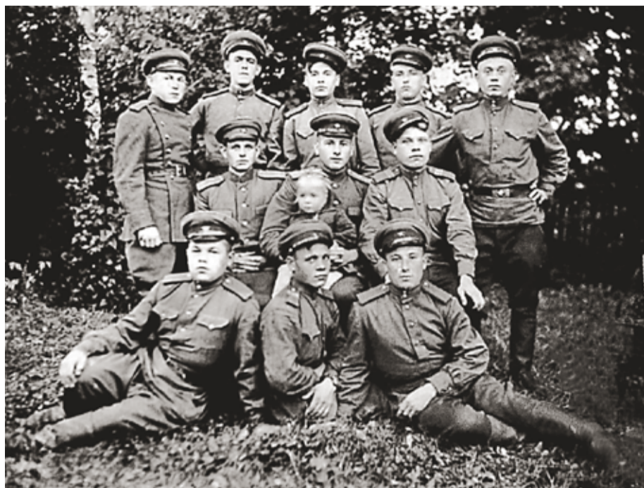
Группа военнослужащих 6-й погранзаставы в посёлке Суворовка 24-го (Озёрск) пограничного Кёнигсбергского ордена Красной Звезды отряда Управления пограничных войск МВД Литовского округа. 1948 год.