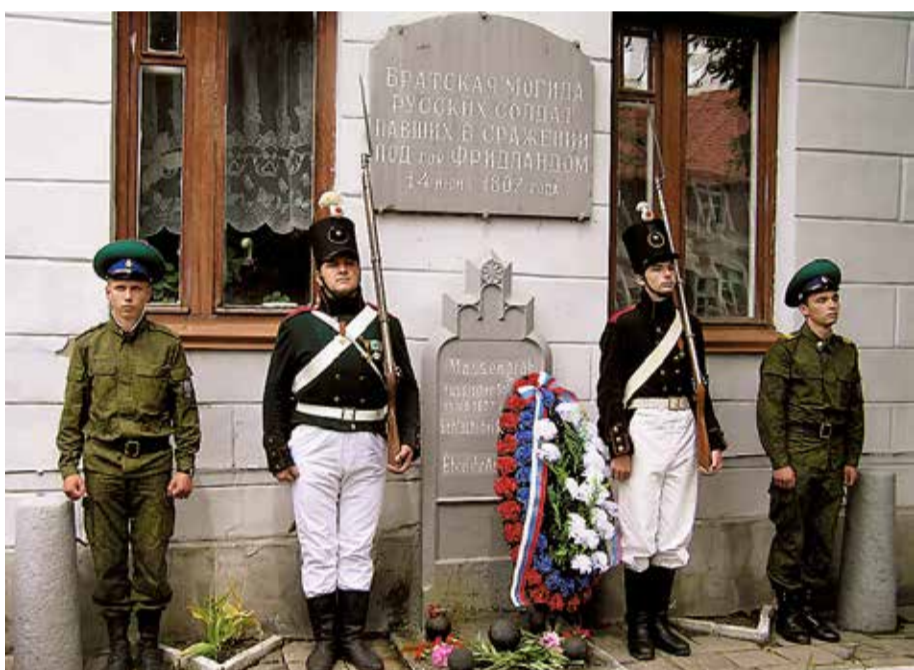
Братская могила русских солдат, павших в сражении с французами под Фридрихсгофом в 1807 году. Отдавая дань памяти в почётном карауле члены военно-исторической реконструкции Фридрихсгофского сражения и военнослужащие Пограничного управления ФСБ России по Калининградской области. Правдинск, улица Кутузова. 2012 год.