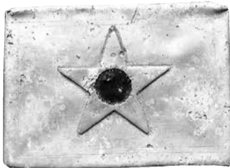
Солдатский портсигар, сделанный из куска дюралевой обшивки сбитого самолета.

Однажды прогуливаясь по берегу реки Витушки (Ярфт) недалеко от мостика в