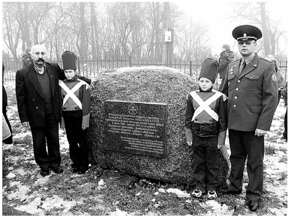
В русских военных мундирах суворовской эпохи – лучшие ученики подшефной Новостроевской средней школы.

А ещё в приграничном посёлке Заозёрное своими руками Георгий Рачикович, но при поддержке, разумеется, друзей и соратников, возвел малый православный храм Георгия Победоносца, посвященный пограничникам России, и единственный на всем порубежье с Польшей обелиск в честь фронтового подвига оперативной разведки Генштаба Красной Армии и НКВД-НКГБ СССР. Ныне это е единственный во всем регионе мемориальный комплекс в честь защитников Отечества из числа представителей силовых правоохранительных структур.