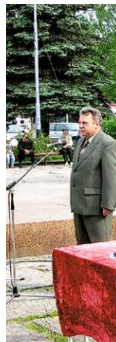
Эстафета Дружбы, народа в Великой Отечественной войне. Черняховск, 2005 год.