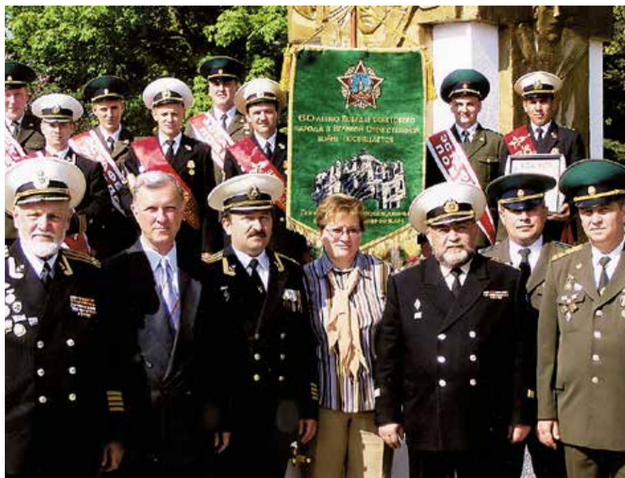
Военнослужащие 3-й отдельной бригады пограничных сторожевых кораблей – участники эстафеты Победы вдоль линии государственных границ государств – участников СНГ. Балтийск, мемориальный комплекс на братской могиле советских воинов, 2005 год.