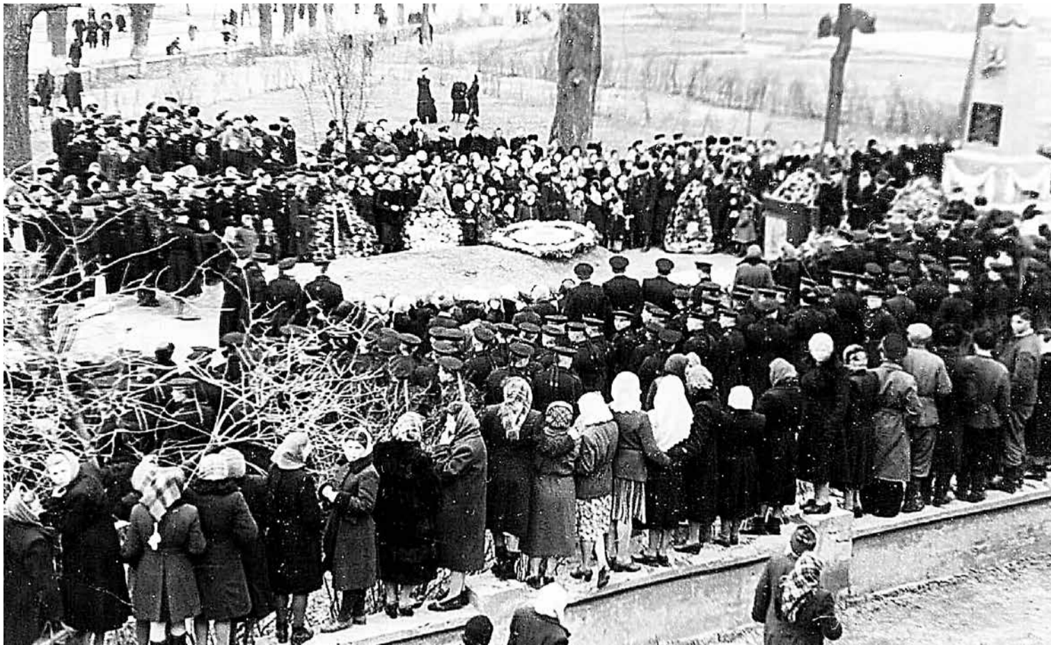
Открытие памятного обелиска погибшим советским воинам. Мамоново, 7 ноября 1952 года.

8 мая 1953 года – калининградские художники провели выставку, на которой были представлены произведения разных жанров, в том числе полотна на исторические темы «Багратион под Прейсиш-Эйлау» и «Черняховский под Инстербургом» В. Митяевского.