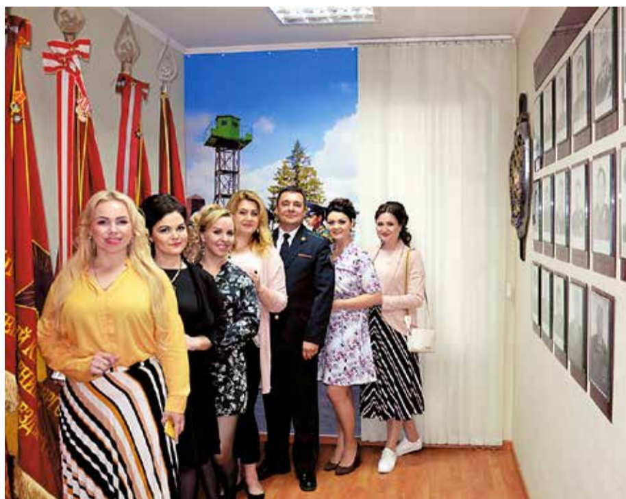
На экскурсии в образовании музейного типа Пограничного управления ФСБ России по Калининградской области женщины границы. Их нельзя назвать слабым полом. Они настойчивые, отважные и бесстрашные. И в то же время остаются обаятельными и чуткими, имея железный характер и волю, которые крайне необходимы для работы.