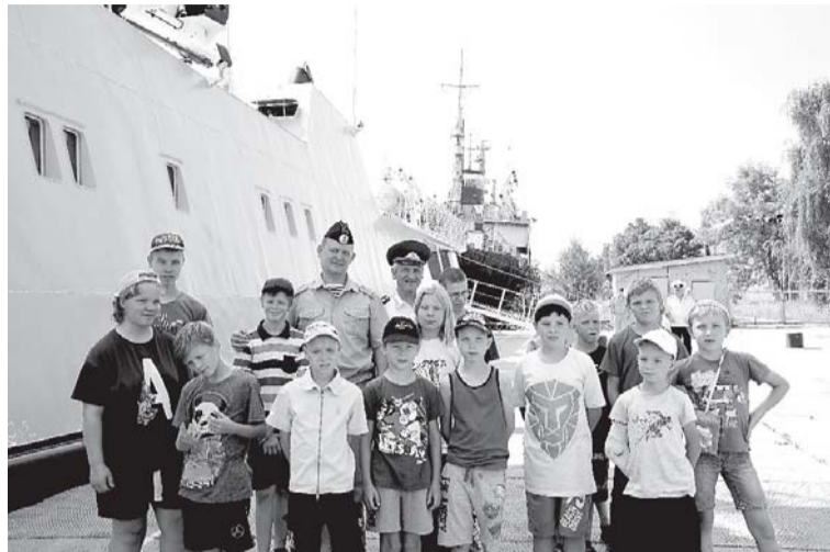
Снимок на память у борта пограничного сторожевого корабля «Василий Грязев» перед возвращением домой.

После подробного инструктажа ребята поднялись на борт сторожевого корабля «Василий Грязев». Многие разработки этого выдающегося тульского конструктора автоматического артиллерийского и стрелкового вооружения не имеют аналогов за рубежом. В День Военно-морского