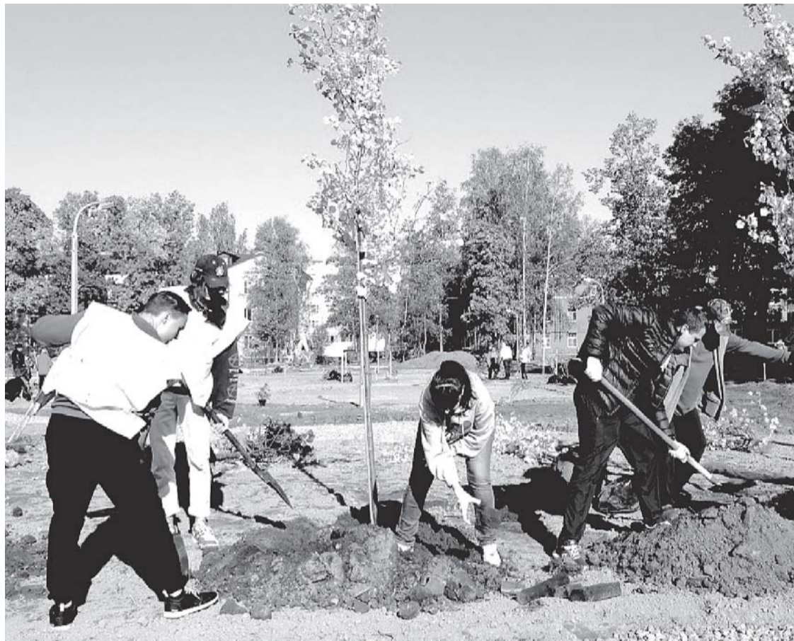
Посадить дерево легко, но за ним нужно ухаживать, а это уже воспитательный процесс.

Странная история получается. Одни люди из чистых побуждений сажают деревья, другие, вроде бы тоже из чистых побуждений, периодически выкашивают вокруг них траву. В итоге же мы получаем умирающий набор чахлах растений, которые вряд ли способны создать тот самый символический цветущий сад.