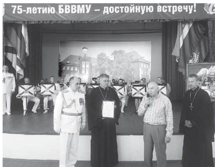
Переданная в дар икона праведного воина Феодора Ушакова станет главным фактором в духовном и нравственном воспитании подрастающего поколения военно-морских офицеров.