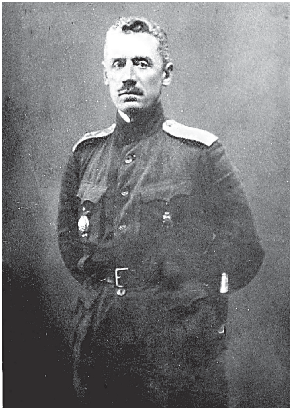
Пётр Иванович Залеский (1867 – 1944) – русский генерал-майор, военный писатель, участник Первой мировой войны.