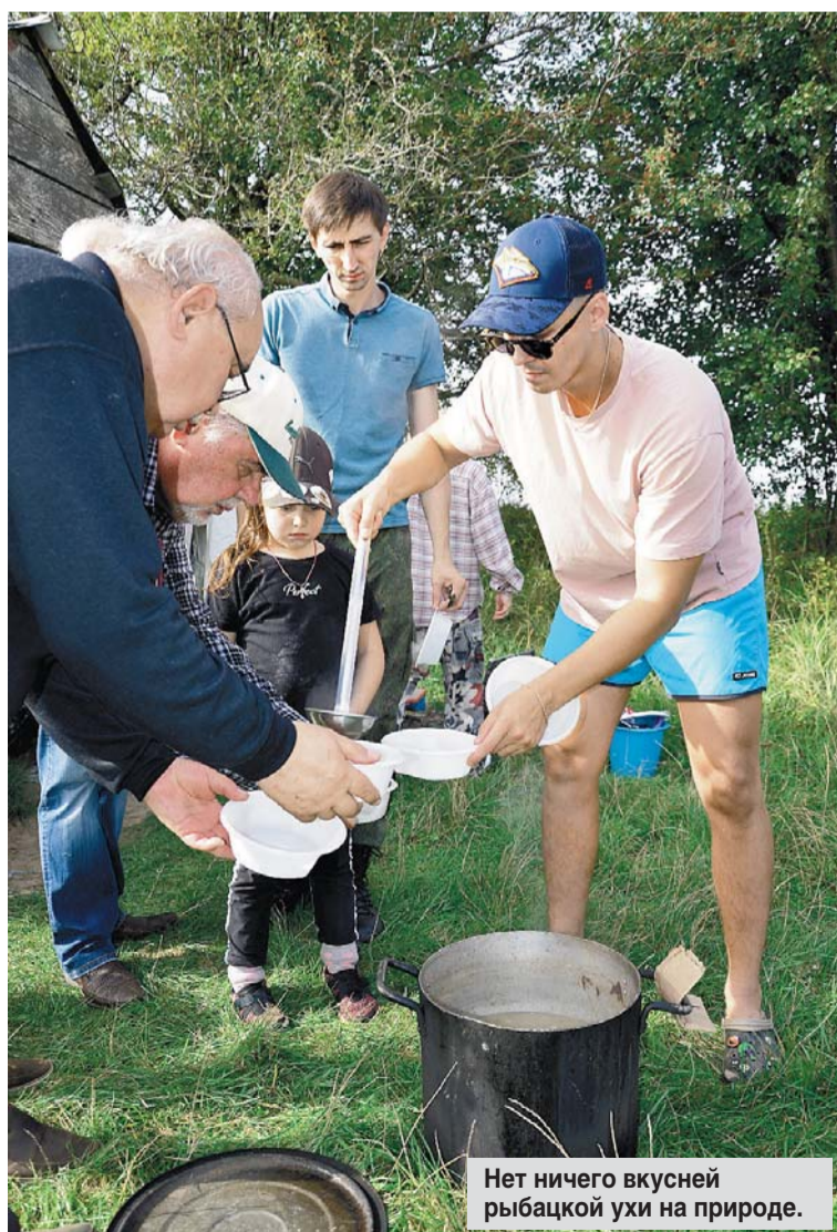
Нет ничего вкусней рыбацкой ухи на природе.