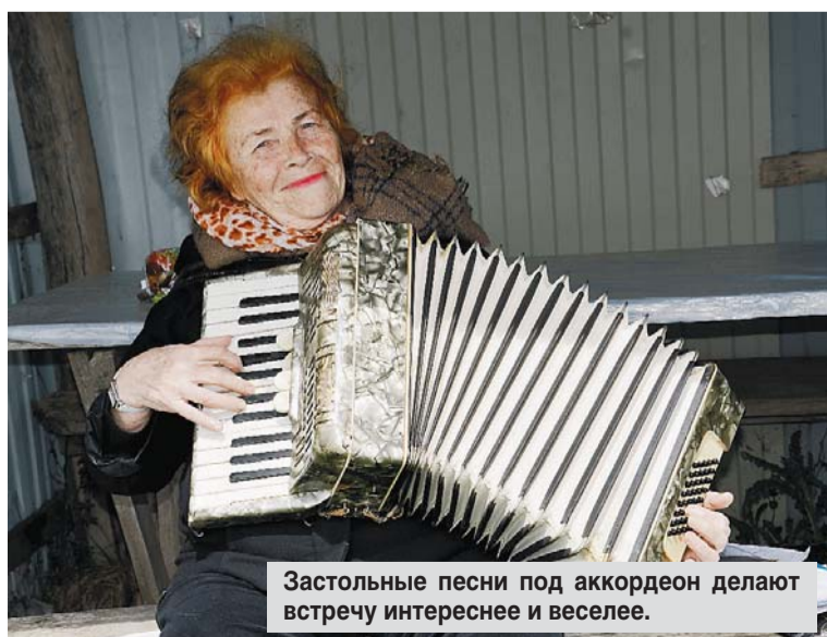
Застольные песни под аккордеон делают встречу интереснее и веселее.