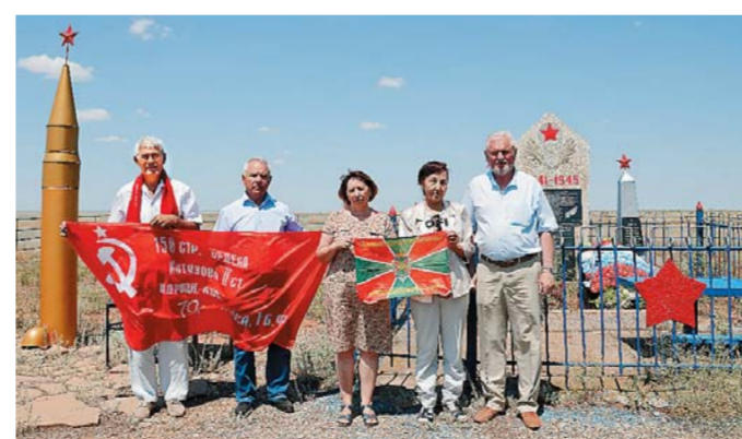
Воинское захоронение в урочище Шалда Черноземельский улус (Яшкульский район).