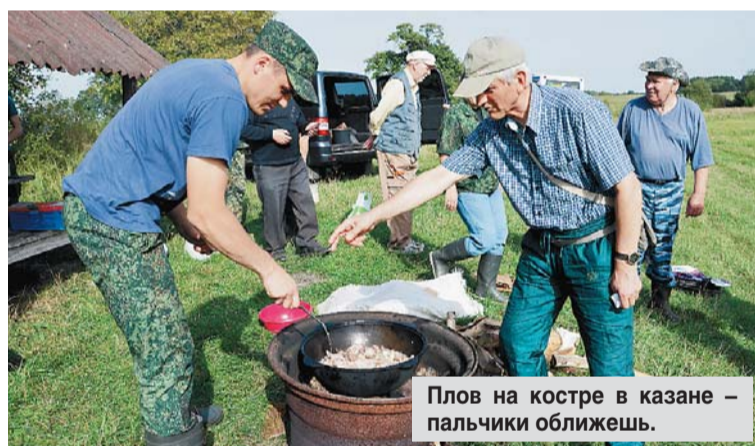
Плов на костре в казане – пальчики оближешь.