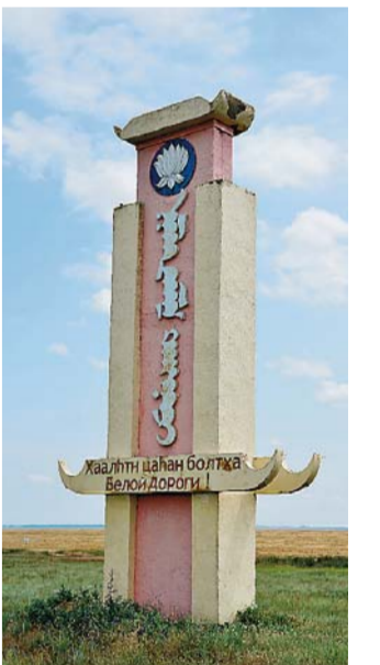
Пожелание белой дороги – пожелание чистого, светлого пути, без препятствий и трудностей!

На открытии памятного знака в урочище Санцик