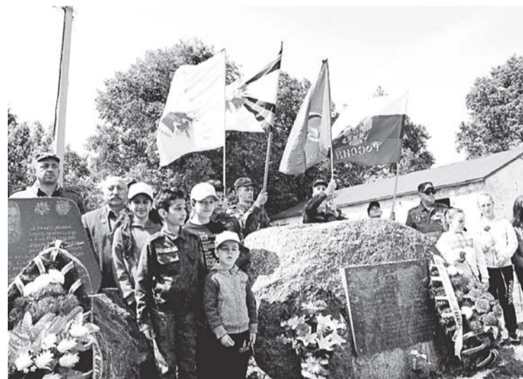
Участники автопробега возложили цветы к памятным знакам советским воинам-разведчикам в посёлке Заозёрное Озёрского района.

В июне 2015 года Евгений Николаевич был назначен начальником управления ФСБ России по Калининградской области, в июле 2016 года – временно исполняющим обязанности губернатора Калининградской области, затем заместителем директора ФСБ России. С 2018 по 2021 год являлся министром Российской Федерации по делам гражданской обороны, чрезвычайным ситуациям и ликвидации последствий стихийных бедствий, членом Совета безопасности Российской Федерации. В сентябре 2021 года Е. Зиничев трагически погиб при исполнении служебного долга, спасая человека. Указом Президента Российской Федерации ему было присвоено звание Героя Российской Федерации (посмертно).