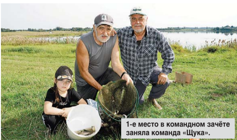
1-е место в командном зачёте заняла команда «Щука».