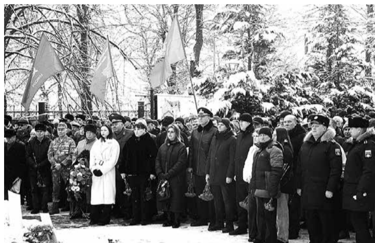
Скорбь в сердце, слезы на глазах и вечная память.